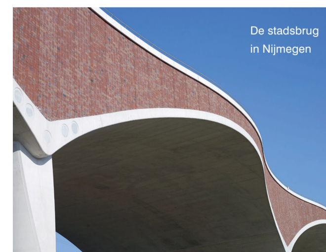
De stadsbrug in Nijmegen

Duurzaam produceren is bij Wienerberger doorgevoerd in de gehele keten. Door het gesloten productieproces van water en klei gaat defacto niets verloren. Sinds 2009 zijn onze milieuprestaties geborgd door de ISO 14001-certificering. Deze borging betekent dat alle milieu-aspecten van de productie in kaart zijn gebracht en jaarlijks worden gecontroleerd.