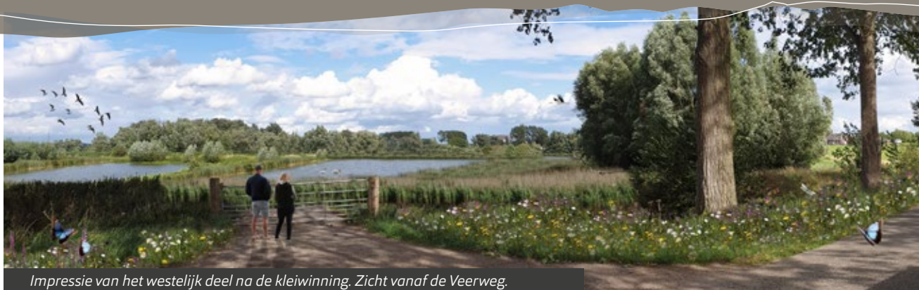
Impressie van het westelijk deel na de kleiwinning. Zicht vanaf de Veerweg.